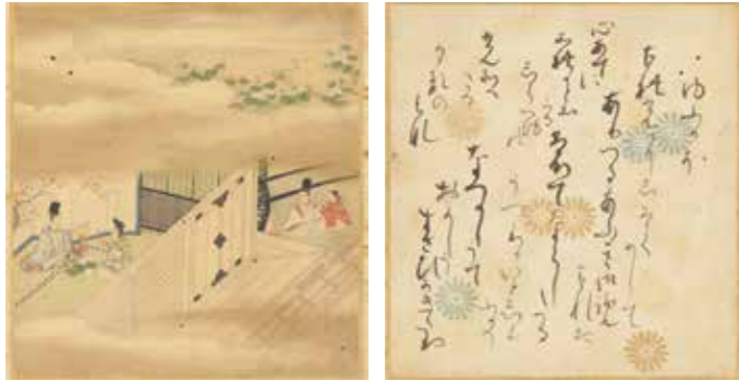
同志社大学図書館所蔵 源氏御手かゝみ No.6

夕顔の巻全体の四分の一ほど読みましたが、ようやく夕顔の君が現われたばかりです。ですから、それまでの内容を知らずに今学期から参加される方も十分に楽しめます。光源氏と夕顔との蜜月は、あつがなく幕切れとなります。かぐや姫が十五夜に昇天したように、夕顔は名月の翌日、物の怪に取りつかれ急死するからです。息絶える夕顔の君の最期の描写は圧巻です。薄気味悪い雰囲気はそこだけではなく、巻頭から随所に散りばめられています。注意して読んでみましょう。この物の怪の正体は不明で、学会でも定説はありません。最有力候補は六条御息所で、その邸宅には朝顔が植えられています。当時、朝顔は貴族、夕顔は庶民の家に植えられていました。この巻は朝顔と夕顔の争い、とも解釈できます。(岩坪健記)