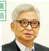
ほさか まさやす ノンフィクション作家 評論家 保阪 正康 日本近現代史研究者

1939年札幌市生まれ。1963年同志社大学文学部社会学科卒。1972年「死なう団事件」で作家デビュー。2004年個人誌「昭和史講座」の刊行をはじめ一連の昭和史研究により菊池寛賞受賞。2017年「ナショナリズムの昭和」で和辻哲郎文化賞を受賞。近現代史の実証的研究を続け、これまで約4000人の人々に聞き書き取材を行っている。立教大学社会学部兼任講師、国際日本文化研究センター共同研究員などを歴任。現在、朝日新聞書評委員などを務める。近著「昭和史の核心」(PHP研究所/2022) 『Nの廻廊 ある友をめぐるきれぎれの回想』(講談社/2023) 文藝春秋で「日本の地下水脈」連載中。ラジオ出演 月曜「NHKラジオ・アーカイブス ～声をつづる昭和人物史」